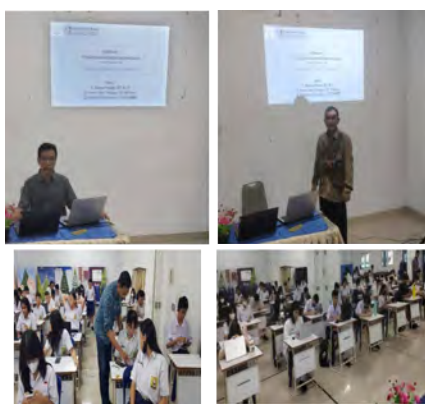
Gambar 2. Dokumentasi Kegiatan Pelaksanaan Seminar Bijak Bersosial Media Di Era Society 5.0