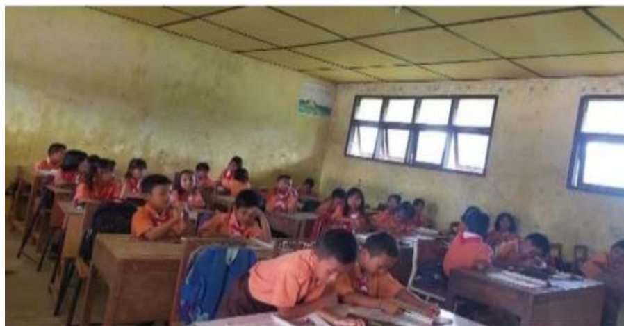
Gambar 5. Peserta didik sedang saling berdiskusi dan berkolaborasi dengan sesama teman