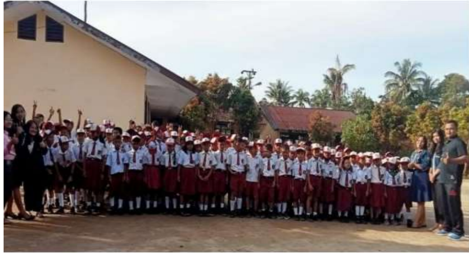
Gambar 3. Peserta didik berfoto bersama Tim PkM dari BSM