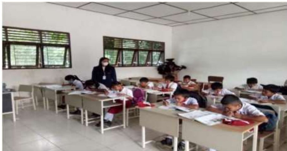
Gambar 4. Anggota Tim sedang melakukan pembimbingan kepada peserta didik